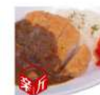
濃厚手作り カツカレー 890円