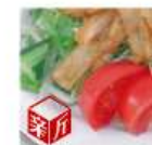
カリカリ ゴボウサラダ 590円