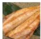
ホッケ焼き 890円 半身 690円