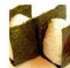
おにぎり(鮭・梅) 味噌汁付き 490円