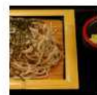
ざるそば うどん 490円