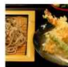
天ざるそば うどん 690円