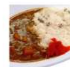
濃厚 手作りカレー 690円