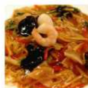
あんかけ焼きそば 790円